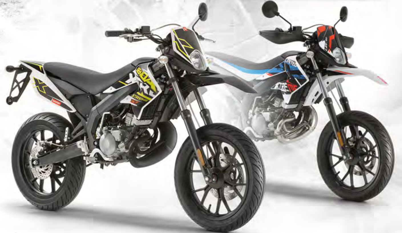
Senda DRD X-Treme 50 SM