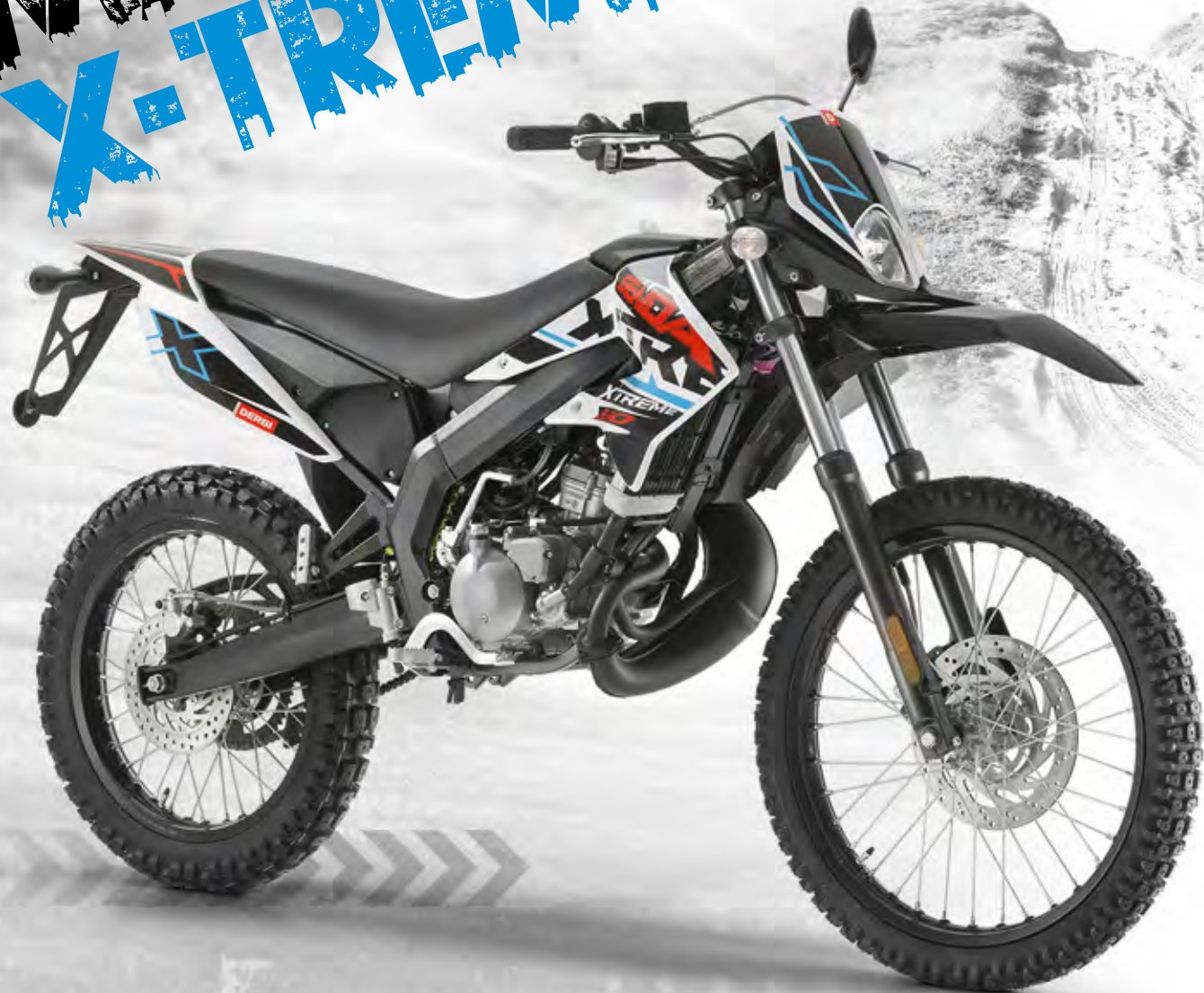
Senda DRD X-Treme 50 R